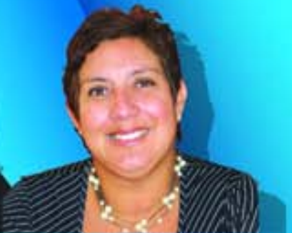
Yudella Credit & Collections